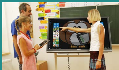
S využitím moderních pomůcek