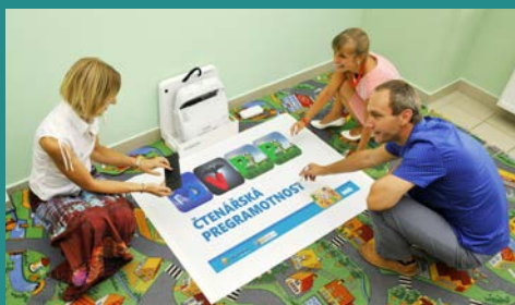
Prakticky a názorně