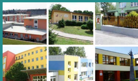
Přímo ve škole